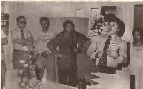
Inauguracion di Sportbuero nobo na watertoren.

Na delegacionnan deportivo cu ta bin Aruba for di exterior Gobierno Insular ta demostra tur clase di hospitalidad y cooperacion, manteniendo asina e bon nomber di Aruba.